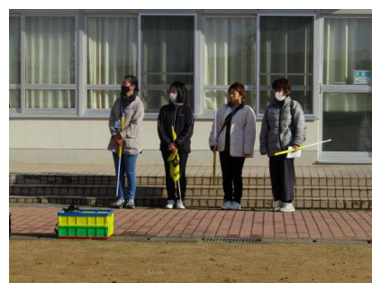
ボランティアの方々

見事、全員が完走しました。辛さ、苦しさを乗り越え、強い心を身につけたことを褒めました。各学年男女1位の成績は次の通りです。